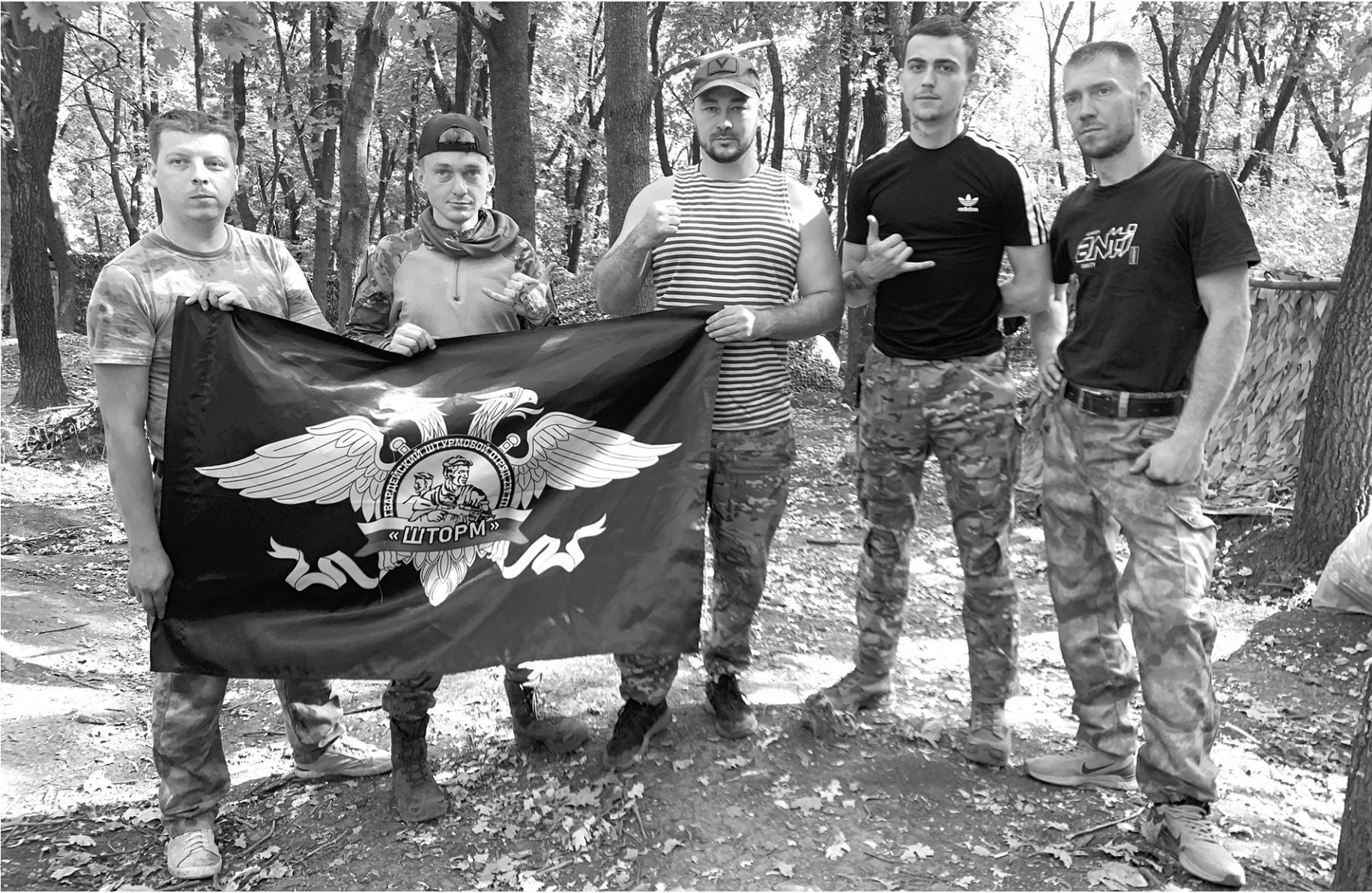
Бойцы гвардейского штурмового отряда «Шторм»