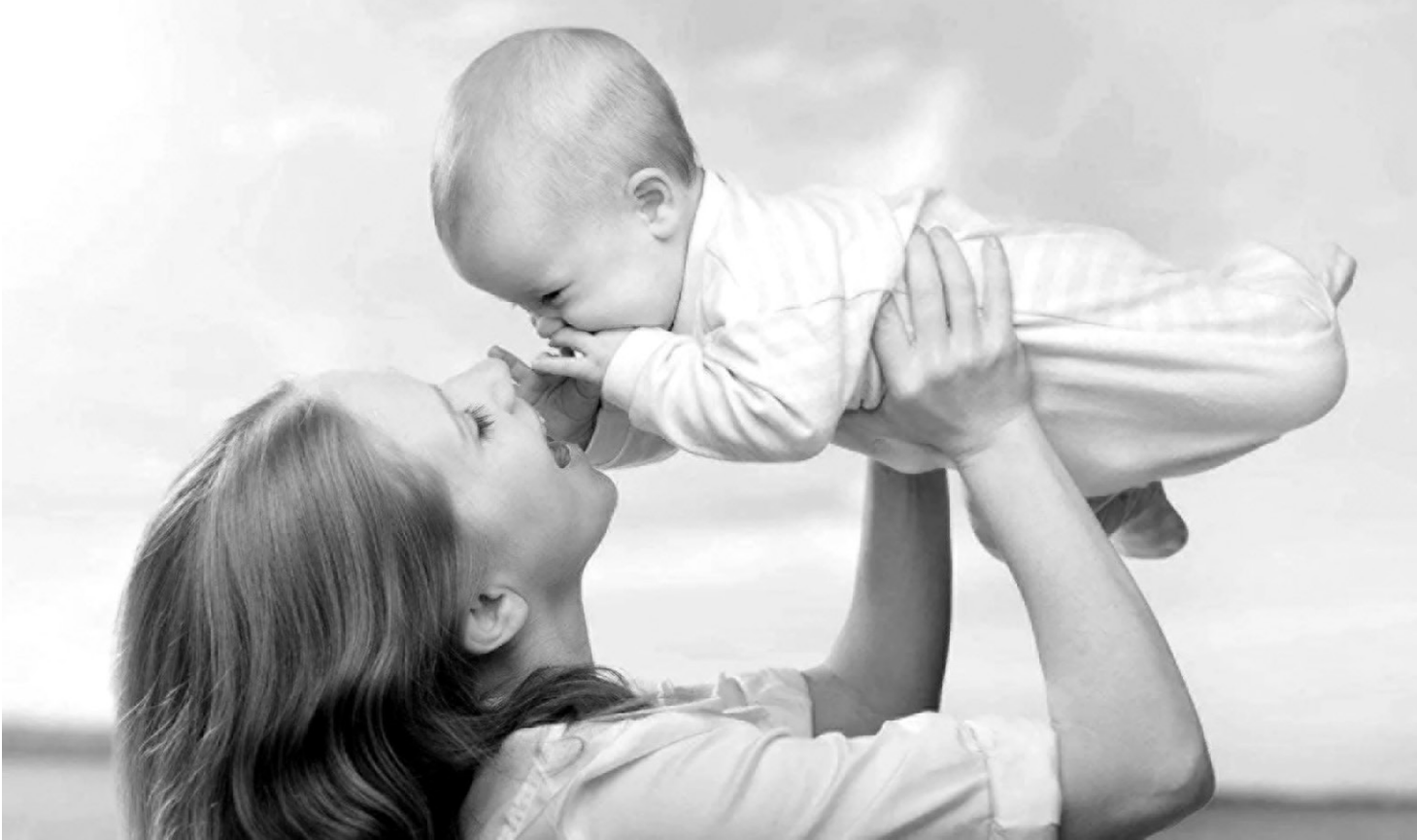
Здоровью ребенка в нашей стране уделяется огромное внимание

— Для повышения эффективности и качества оказания медицинской помощи беременным женщинам, для снижения перинатальной и младенческой смертности с мая 2014 года началась