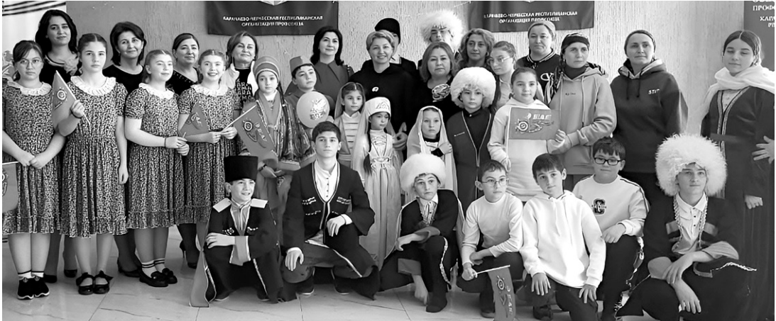
Участники тура выходного дня