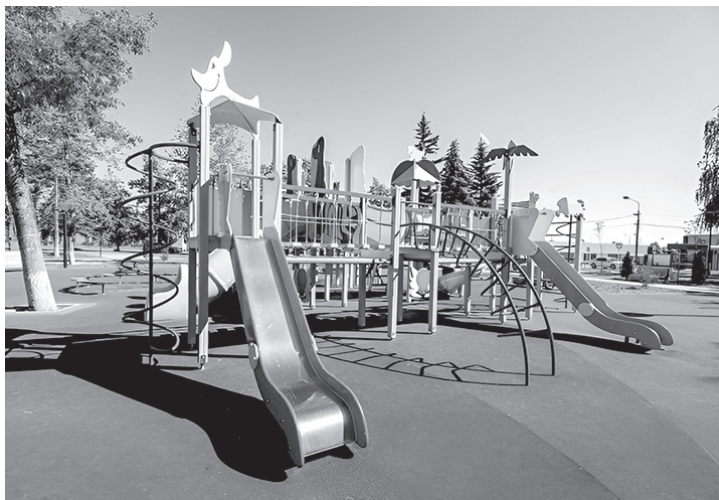
В районе ведется большая работа по благоустройству

— Каким образом район включился в эту повестку?