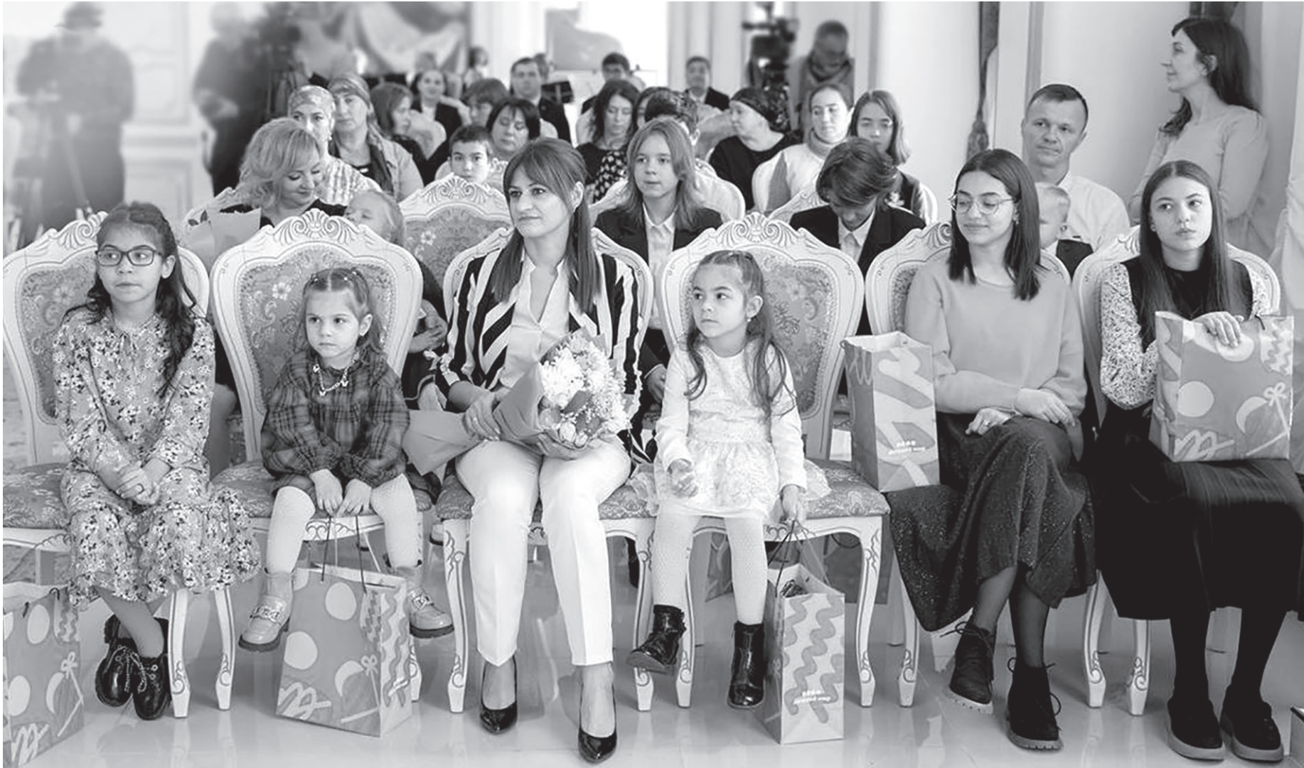
В нашей республике более трех тысяч многодетных матерей

Открывая форум, полномочный представитель Президента Российской Федерации в Северо-Кавказском федеральном округе Юрий Чайка отметил, что Северный Кавказ всегда славился большими и крепкими семьями, где при возникновении различного рода сложностей стараются не передавать детей в государственные учреждения, а воспитывать их в кругу родственников и близких людей. «Это буквально «заложено в ДНК» наших граждан. Вместе с тем, определяя ключевым приоритетом защиту интересов ребенка в любых жизненных ситуациях, в регионах округа продолжают прикладывать большие усилия для профилактики социального сиротства и помощи родителям в детстве. Уверен, что сообща мы сможем сделать всё для решения стоящих перед нами задач», — сказал Юрий Чайка.